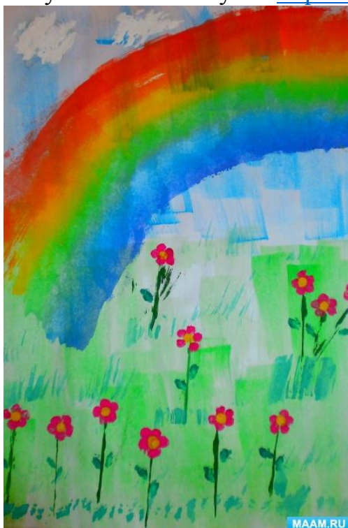
Рисунок «Летний луг» - https://clck.ru/NPRAx

Детская песня Лето ты какого цвета - https://youtu.be/s9QJTuasXjk